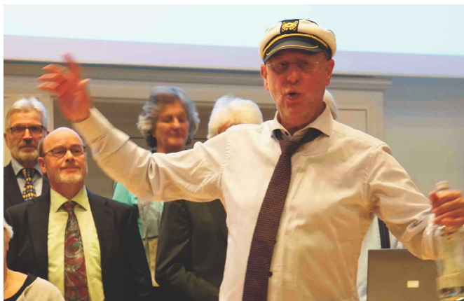
The drunken sailor, Dido & Aeneas, 2018