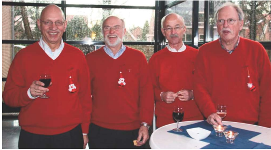
De Oranjebrigade, 2011 Ook dit concert staat een Oranjebrigade weer paraat