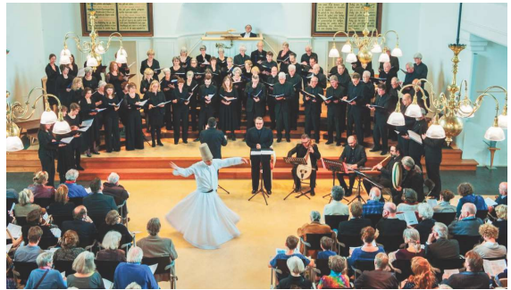
Sacred Bridges, 2014

(Christelijk, Joods en Moslim); met musici uit verschillende landen en een derwisch-danser, onder de naam Sarband, d.w.z. Verbinding. Het Basilius College nam de prachtige psalmen van Sweelinck voor zijn rekening en het geheel stond onder leiding van King's Singer Stephen Connolly.