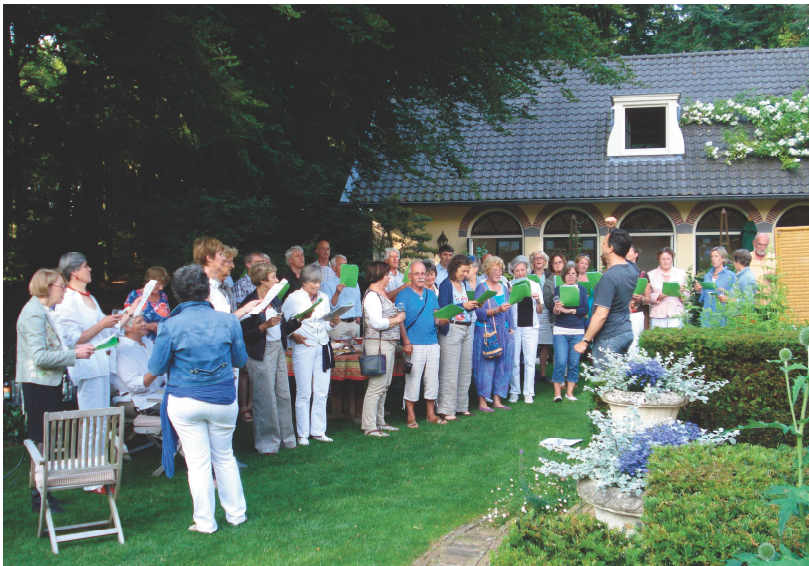
Feestelijke slotavond, 2012